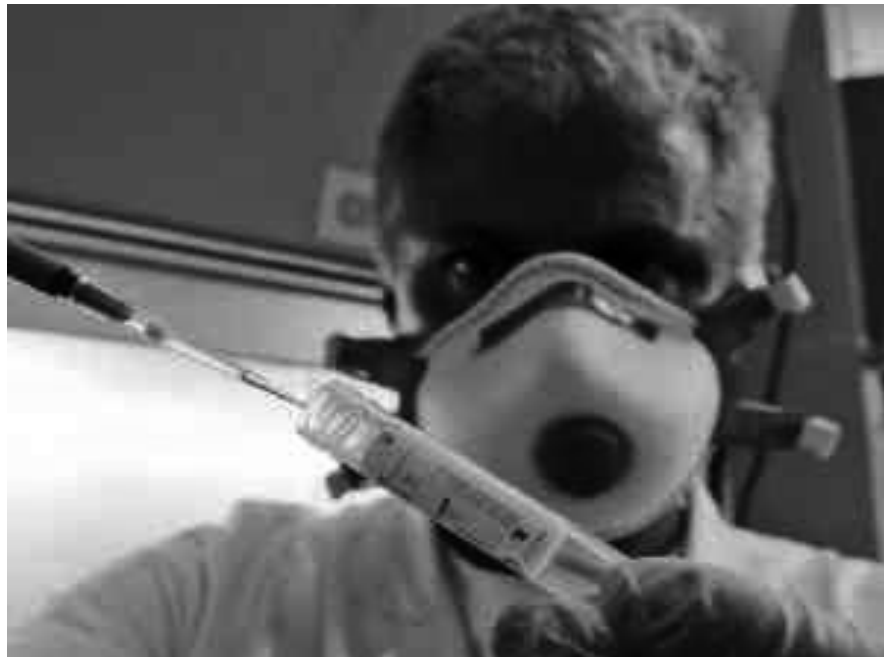
Laboratorio de fabricación de vacunas

de informar a los compañeros y empleados de sus centros de trabajo, se pide que comuniquen a REX lo más rápidamente posible la baja por gripe A.